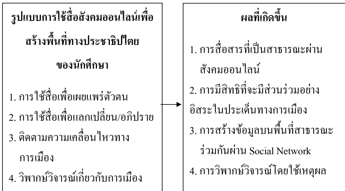
ภาพ 1 ความสัมพันธ์ของตัวแปรที่ศึกษาวิจัย

ผู้วิจัยได้ใช้แนวคิดของ Jurgen Habermas มากำหนดเป็นแนวคิดทฤษฎี ซึ่งเขาเชื่อว่า การก่อตัวของมวลชนที่ใช้เหตุผลโดยมีความสนใจร่วมกันที่เป็นสาธารณะ หรือ ประโยชน์ส่วนรวมของสังคม ทำให้เกิดการสื่อสารข้อมูลในรูปแบบที่มีการแสดงความคิดเห็นทางการเมืองในรูปแบบต่าง ๆ ซึ่งปัจจุบันสื่อสังคมออนไลน์ถือเป็นพื้นที่สาธารณะหนึ่งที่เกิดการแสดงออกในรูปแบบต่าง ๆ เช่น การเขียนบทความ การแสดงความคิดเห็นตามเพจต่าง ๆ หรือเรื่องราวที่เกี่ยวข้องทางการเมือง เป็นต้น ซึ่งต่อมาก่อให้เกิดเครือข่ายทางสังคมขึ้น และเป็นการก่อให้เกิดพื้นที่ความเป็นประชาธิปไตย ซึ่งมีการใช้สื่อสังคมออนไลน์เพื่อต่อต้าน เรียกร้อง รวมกลุ่ม สนทนา แลกเปลี่ยนแสดงความคิดเห็น สร้างกิจกรรมทางการเมือง เศรษฐกิจ สังคม เกี่ยวกับสิทธิเสรีภาพ ความเสมอภาค การบริหารประเทศ หรือนโยบายของรัฐ