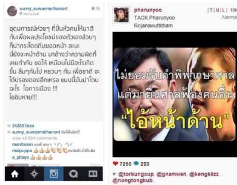
ภาพ 6 ตัวอย่างการใช้สื่อออนไลน์แสดงความคิดเห็นทางการเมืองผ่าน Twitter

ปัจจุบันรูปแบบการวิพากษ์วิจารณ์ทางการเมืองโดยใช้สื่อออนไลน์มีการกระทำหลายรูปแบบนอกจาก Facebook หรือ Line แล้วยังมี อีก 2 Application ที่เป็นที่ยอมรับ เช่นกัน ได้แก่ Instagram เป็น Application บนมือถือที่นักศึกษาปริญญาโท ใช้โพสต์ข้อความ ภาพในประเด็นที่เราสนใจ ไม่ว่าจะเป็นการแสดงออกทางการเมือง หรือ แสดงความคิดเห็นส่วนตัวด้วยการ โพสต์ในลักษณะส่วนตัว ทั้งนี้บุคคลอื่นสามารถติดตาม Instagram ของเรา หรือเราอาจไปติดตามบุคคลอื่น ๆ ที่มีแนวความคิดทางด้าน การเมืองที่เป็นไปในแนวทางเดียวกันได้ ขณะเดียวกันก็สามารถเลิกติดตามกันเมื่อ การแสดงความคิดเห็นในประเด็นต่าง ๆ นั้นสวนทางกัน จากการสัมภาษณ์กลุ่มตัวอย่าง ของนักศึกษาพบว่า มีการใช้สื่อสังคมออนไลน์เพื่อวิพากษ์วิจารณ์ประเด็นทางการเมือง ได้แก่ (ธัญญา อินทรพรหม, ธนากร แก้วลอย, พนิดา เพชรสร, สกาวเดือน หวดพงศ์ และ สมหญิง พวงพิพัฒน์, การสัมภาษณ์ส่วนบุคคล, 5 ตุลาคม 2562) ได้ใช้สังคมออนไลน์ ได้แก่ Facebook Twitter ในการแสดงความคิดเห็นต่อสถานการณ์ทางการเมืองที่เกิดขึ้น รวมถึงบางครั้งได้ติดตาม หรือแชร์ข่าวสารทางการเมืองที่เกิดขึ้น