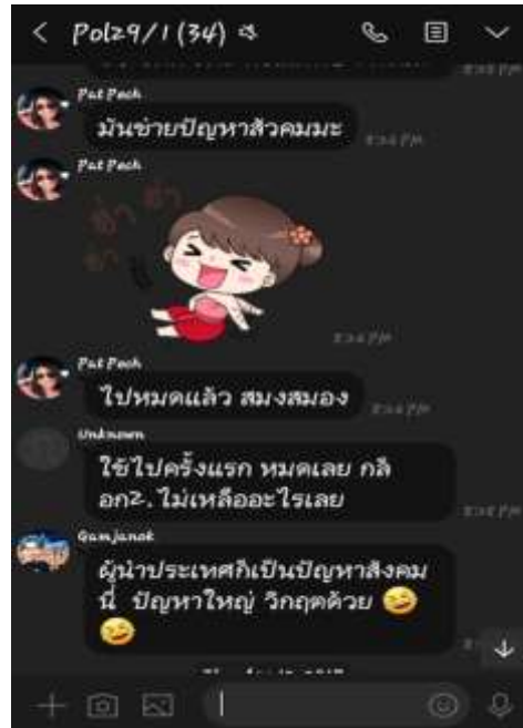
ภาพ 4 ตัวอย่างการใช้สื่อออนไลน์แสดงความคิดเห็นทางการเมืองผ่าน Line

ประเด็นเดียวกัน รวมถึงเป็นช่องทางในการแลกเปลี่ยนความรู้ในการเรียนระดับปริญญาโทที่สำคัญอีกด้วย เนื่องจากส่งได้ทั้งไฟล์ข้อความ ไฟล์ภาพ และไฟล์เสียง เป็นลักษณะการใช้ส่วนตัว ตัวอย่างดังแสดงในภาพ 4