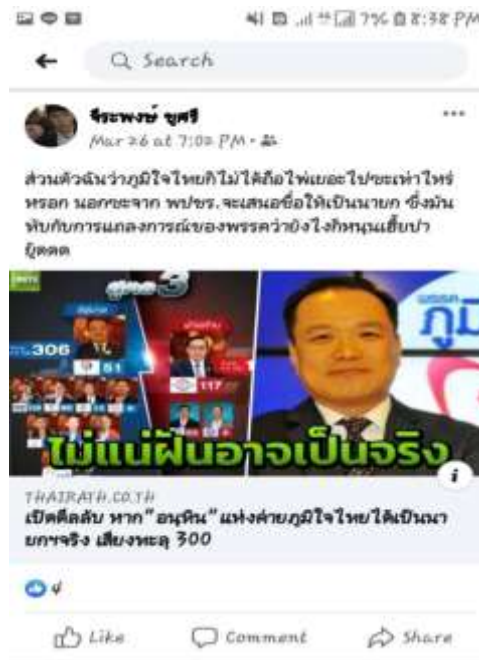
ภาพ 3 ตัวอย่างการใช้สื่อออนไลน์แสดงความคิดเห็นทางการเมืองผ่าน Facebook

อย่างเช่น กลุ่มประวัติศาสตร์เที่ยงคืน เป็นต้น (สิทธิพร ราชธานี, การสัมภาษณ์ส่วนบุคคล, 5 ตุลาคม 2562) ได้กล่าวว่า เราสามารถใช้สังคมออนไลน์เชื่อมโยงข้อมูลเข้าหากันได้อย่างรวดเร็วทั้งยังเชื่อมโยงผู้คนได้จำนวนมาก ก่อให้เกิดชุมชนเสมือนจริงสามารถรวบรวมกลุ่มคนที่มีแนวคิดและจุดมุ่งหมายเดียวกันมาอยู่ด้วยกันได้